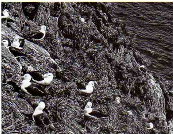
Fig. 2.- A) Vista parcial de la colonia.