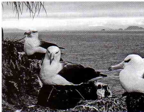
Fig. 2.- B) Adultos incubando.

una colonia de unos 500-600 nidos de cormoranes imperiales ( Phalacrocorax atriceps ), una pequeña colonia de 130 parejas de pingüinos macaroni ( Eudyptes chrysolophus ), y varios lobos de dos pelos ( Arctocephalus australis ).